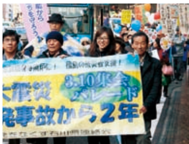
原発ゼロを訴えパレード(3月10日)

原発と人類は共存できません。活断層の危険が指摘され、核廃棄物処理の見通しもない原発は、即時ゼロこそ、もっとも現実的です。再生可能エネルギーの急速な普及こそ、地域に密着した仕事と雇用をつくりだします。