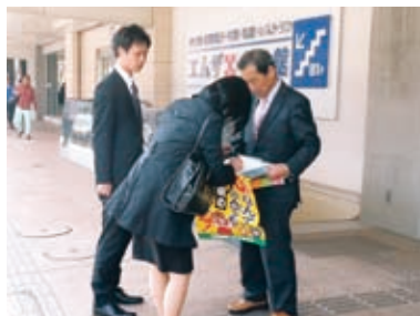
消費税増税中止求め署名活動(3月25日)