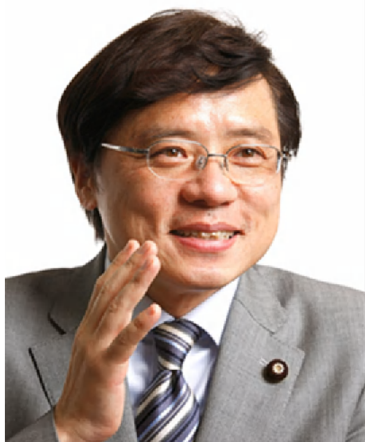
井上さとしプロフィール

井上さとし参議院議員が、国会でのたたかいの展望、焦点の課題での日本共産党の見解と改革の提案をわかりやすくお話しします。ご期待ください。