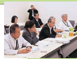
志賀原発廃炉もとめ政府交渉

志賀原発の問題を議会で厳しく追及。住民運動と力を合わせ国・県・北陸電力にも繰り返し申し入れられました。