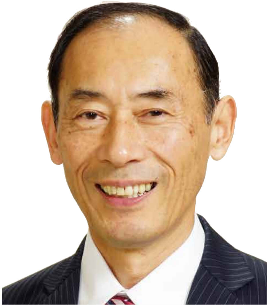
党白山市くらし・福祉対策委員長