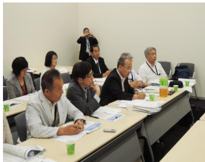
経済産業省と交渉 2014年6月28日