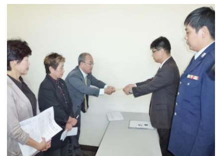
小松基地に申し入れ 2014年6月5日