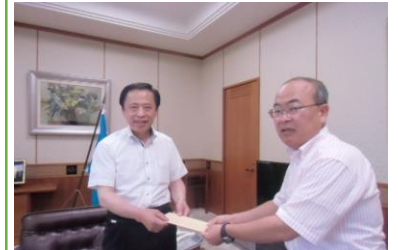
海外視察中止など議会改革で申し入れ 2014年8月5日