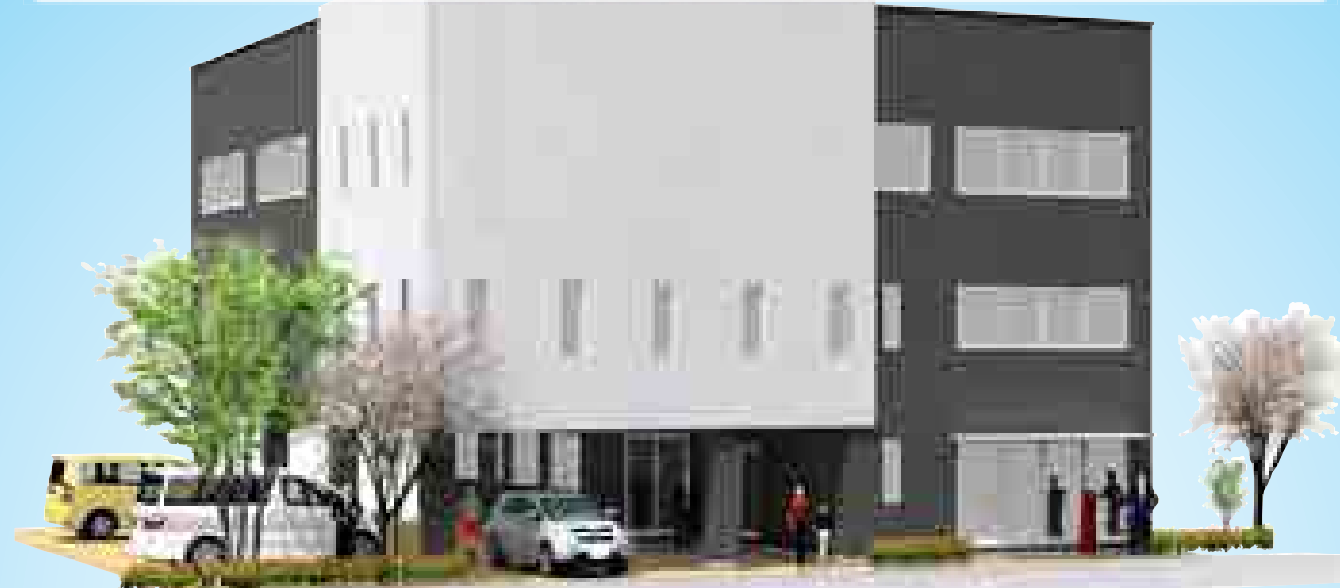
日本共産党石川県委員会新事務所建設予想図 (鉄骨造三階建 現事務所前道路側より)