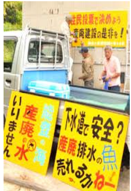
(写真は、インターネットから転載)