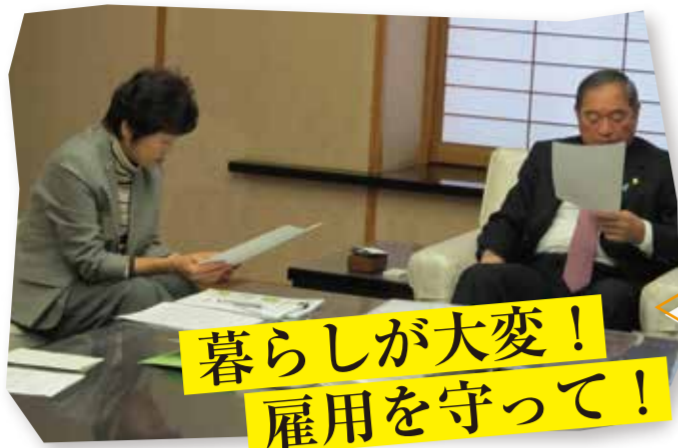
山田市長に申し入れる宮岸議員(左)